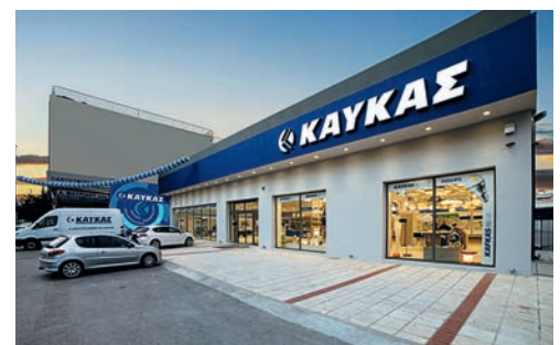
Το νέο κατάστημα της ΚΑΥΚΑΣ στη Θεσσαλονίκη: κεφάτο, φιλικό και, όπως πάντα, άκρως επαγγελματικό.