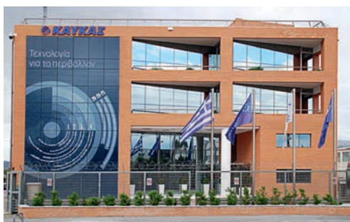
Τα νέα Κεντρικά Γραφεία της ΚΑΥΚΑΣ στην Παιανία Αττικής διαθέτουν πλέον επαρκείς χώρους ώστε να στεγαστούν όλα τα τμήματα της κορυφιαίας ελληνικής εταιρείας ηλεκτρολογικού εξοπλισμού.